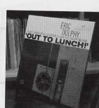
ERIC DOLPHY / Out To Lunch (MusicMatters MMSST64163) 超重量盤45回転2枚組の変態仕様複製盤!

約 1年の紆余曲折を経て、ささやかながら念願の音楽室が自宅に完成した。「オーディオルーム」なんて呼ぶにはおこがましい、わずか6畳程度のスペースだが、長年の夢だった防音と音響に配慮した専用空間だ。……「そんな小さな部屋では絶対に良い音はしないよ」「防音すると息苦しくて音楽なんて聴けない。絶対に後悔するよ」と、親切なオーディオ愛好家の先輩方はよく「絶対に」と仰る。その貴重なアドバイスを千切っては投げ、自らの信じる方法で完成した部屋は、はたして??