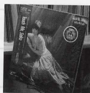
SEIKO MATSUDA / Touch Me, Seiko (CBS/SONY 30AH1616) BEVERLY KENNYのBorn To Be Blueを彷彿とさせるジャケットに、隠れた名曲がずらり。専用の超高級カッティングレースを使用したマスターサウンド盤は、今や跡形もないSONYアナログ技術の結晶。