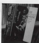
LEE KONITZ / Inside Hi-Fi (ATLANTIC 1258) ヴァンゲル録音の奥深さが味わえる貴重な作品。