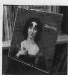
TEDDI KING / Now In Vogue (STORYVILLE STL903) 若く可憐で切ない、おじさまキラーな名盤。