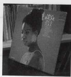
NINA SIMONE / Silk & Soul (RCA LPM3837) R&BなNINAの歌声が堪能できる文句なしの1枚。