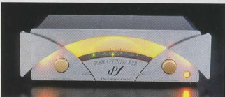
同社初のソリッドステートを採用したプリメインアンプParavicini 312(¥3,129,000)

● 写真のモデル 912 (写真左) プリメインアンプ / ¥2,079,000