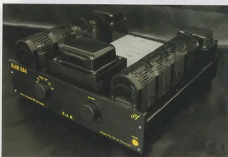
プリメインアンプの834 Custom(¥512,400)は、電源環境などに配慮して設計された日本限定モデル