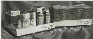
EARの名が世界へ轟きかけとなったモノラルパワーアンプ509 II(¥1,878,450/ペア)