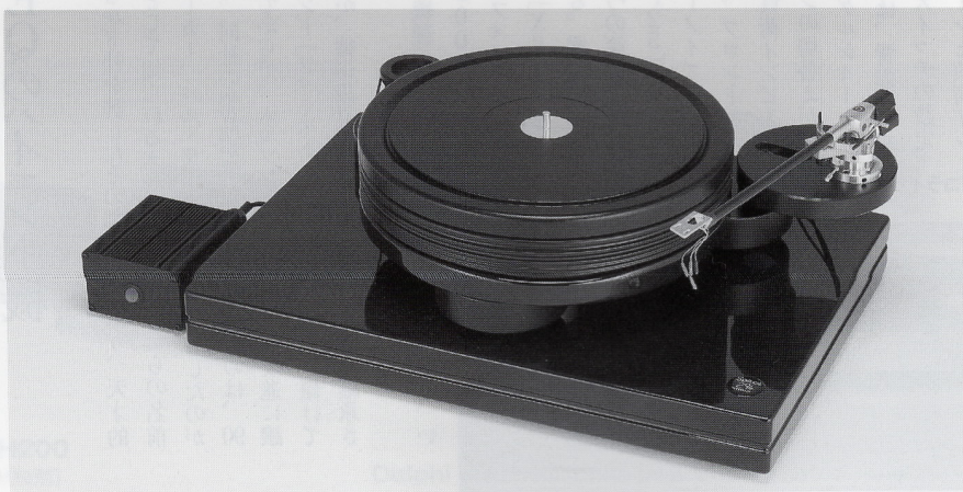
Space 294HD ¥898,000(税別)