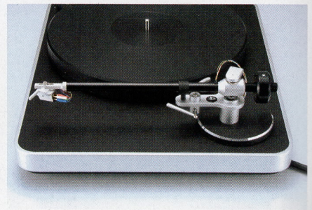
「Verify」フリクションフリートーンアームを採用。ベアリングハウジングの中でアームがフローティングの状態を常に維持できる構造となっている

。トーンアームはVerifyという単体モデルをそのまま搭載している。ハウジング内にマグネットを備え、これとテンションワイヤーの働きによってアームがフローティング状態に置かれるマグネット・ベアリング・テクノロジを採用した洗練された設計で、フリクションすなわち摩擦を極めてゼロに近いところで低減することが可能である。仕上げも精巧で、このクラスのプレーヤーに搭載されるトーンアームとしては、少々贅沢ともいえるであろう。 カートリッジも付属し、人気モデルAurum Wood Classic Mk IIをベースとして専用開発されている。使いやすいMM型で、エントリー・モデルとしては格好の装備といえる。 ニュートラルな感触に富んだバランスの取れた再現性 付帯音のない緻密で質の高い音調だ。レンジを広く取った印象ではないが、帯域の中をきちんと押さえて輪郭のかつちりとした出方をする。付属のカートリッジもくせがなく、当たりが良く浮ついたところのないバランスの取れた再現性を備えている。振動の影響を受けにくいのが背景が静かで、ディテールをていねいに捉えて端正に描き出した感触である。 バロックはヴァイオリンやオーボエの音色が、古楽器らしい小粋な手触りを見せて好ましい。スケールは大きくないが、バロックではむしろの方が正しいといえる。各楽器の質感やニュアンスを適確に捉えて、アン